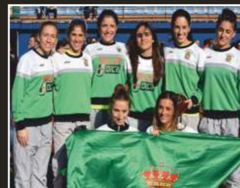
Subcampeonas regionales senior cross corto