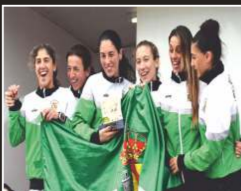
Subcampeonas regionales senior cross largo