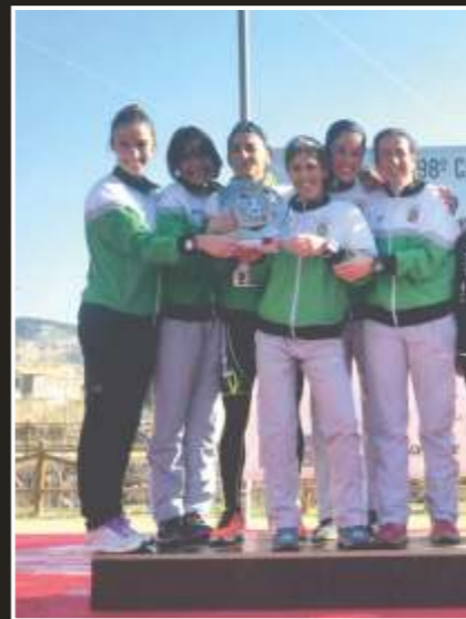
Subcampeonas de España master 35