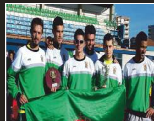
Subcampeones regionales senior cross corto