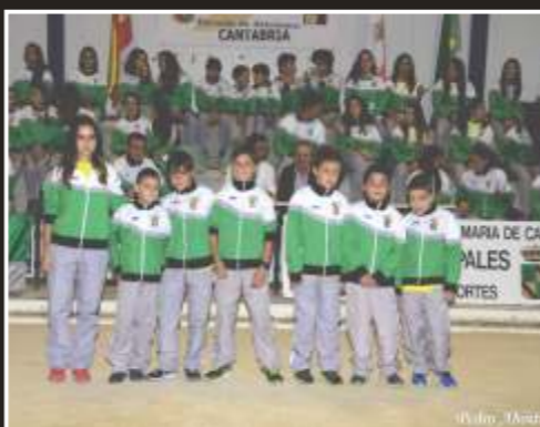
Equipo alevín campeón regional de cross