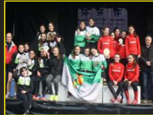
Campeonas regionales de cross cadete femenino