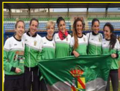
Subcampeonas regionales de cross corto