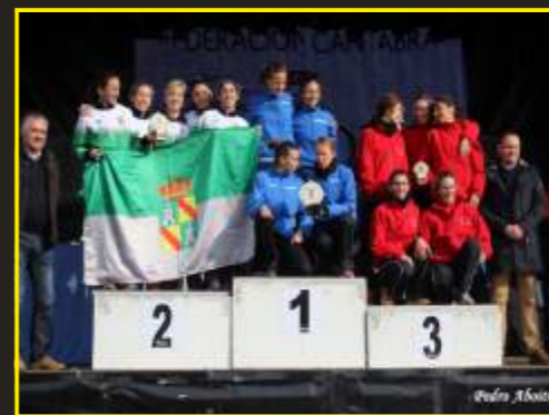
Subcampeonas regionales de cross largo