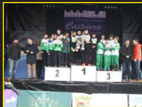
Subcampeones regionales de cross infantil