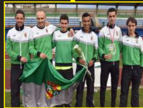
Campeones regionales senior cross corto