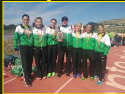
Campeonas de España de cross M-35