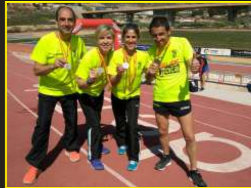
Subcampeones de España de relevo mixto de cross M-45