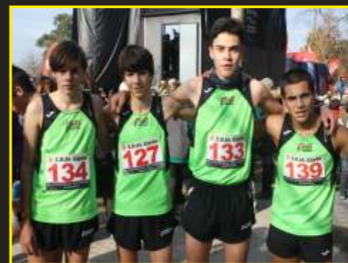
Bronce en campeonato regional de cross juvenil