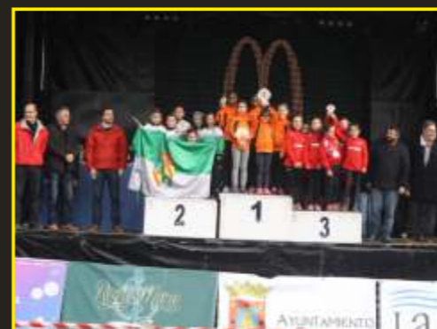
Subcampeonas regionales de cross benjamín femenino