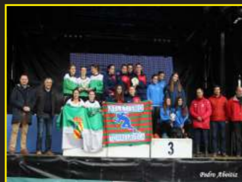
Subcampeonas regionales de cross juvenil