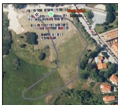
Circuito A: 500m

* Los premios absolutos y máster 40 y 50 no son acumulativos. Los atletas sub23 y sénior únicamente optan a los premios de categoría absoluta.