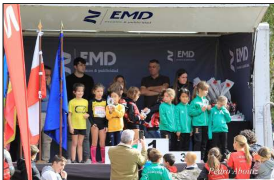
Campeonato Regional por equipos - Bronce Sub 8