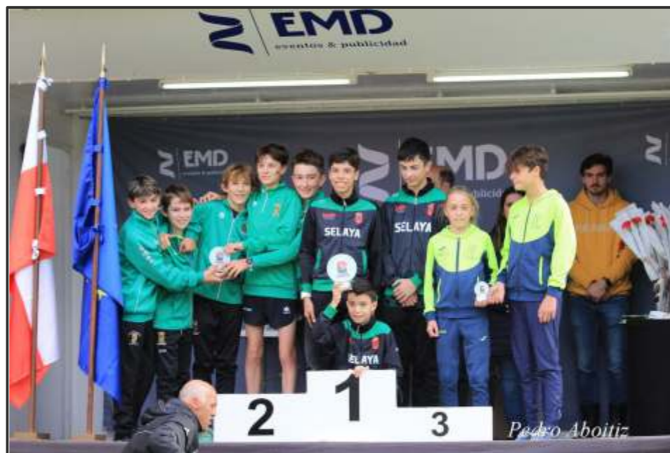
Campeonato Regional por equipos - Plata Sub 14